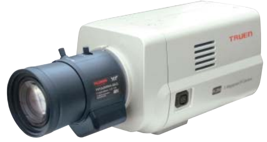
TCAM-330W D1 (720x576)